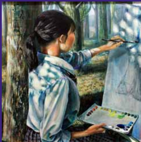
【美術・工芸部門】東京都立八王子桑志高等学校 3年