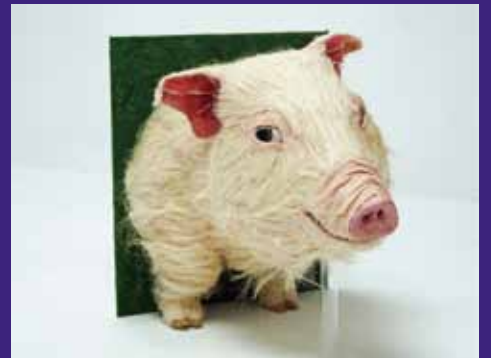
【美術・工芸部門】東京都立総合芸術高等学校 3年