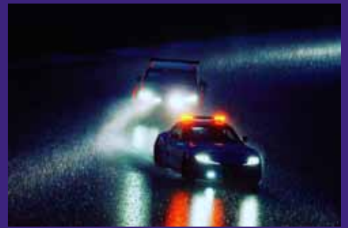
【写真部門】東京都立第一商業高等学校 2年