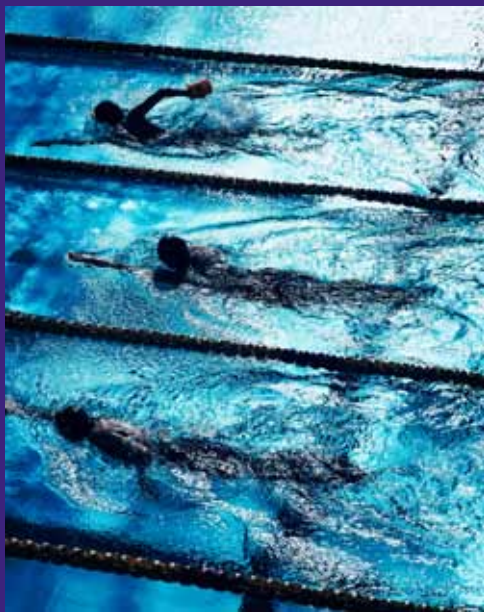
【写真部門】東京都立昭和高等学校 3年