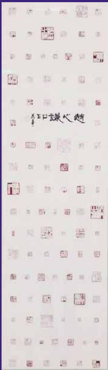
【書道部門】大東文化大学第一高等学校 3年